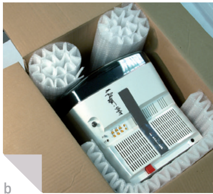
Fixieren und Polstern