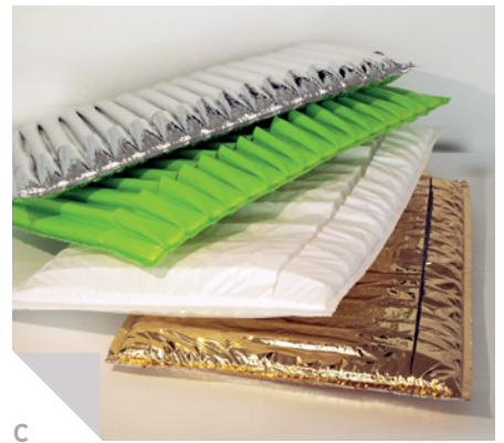
Polstertaschen und Umschläge

Sie möchten mehr über die Polstereigenschaften von Mondaplen erfahren? Fragen Sie uns danach – wir helfen Ihnen gerne weiter!