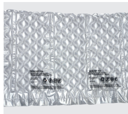
Quilt Air Small