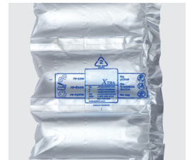
MINI PAK'R EZ