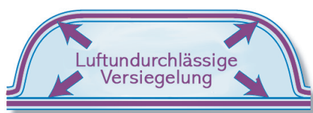
Luftpolsterfolie Effizienz 200