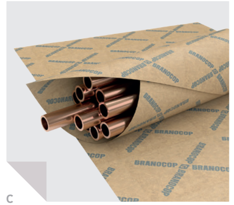
BRANOCOP C-Papier als Coilerverpackung